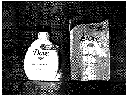
新型インフルエンザ対応として薬用手洗い石鹸